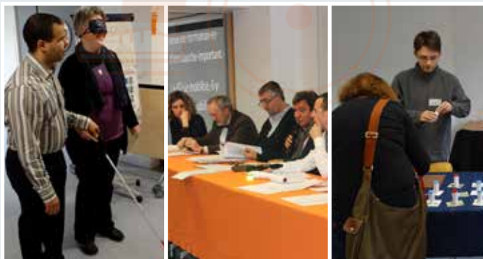
Rencontre régionale, le 10 décembre 2015

Le groupe régional handicap s'appuie sur un partenariat ancien et fidèle avec l'Agefiph. Chaque année une convention est engagée. Celle-ci permet de mener, auprès des adhérents de la CFDT Île-de-France, des actions de formation, de communication et d'information-sensibilisation. Ces actions bénéficient des conseils et du regard expérimenté de l'Agefiph. Cette convention permet de déployer des actions sur l'ensemble du territoire francilien auprès des équipes syndicales.